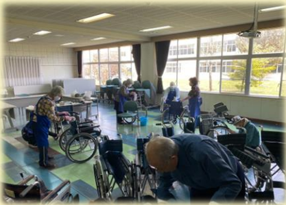
車いす清掃：令和5年5月

市内福祉施設にて利用者の介助や縫い物をしたり、お祭りのお手伝いへ参加したり、友愛セールの出店や福祉パネル展への参加、配食サービスを利用されている方の食事の配達をしたりと、活動内容は多岐にわたりました。また、社協で市民の皆様へ貸し出ししている車いすの調整・清掃する活動も例年行っていました。